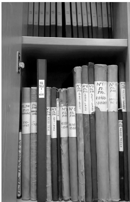
1. attēls. Vēsturiskās LU Filoloģijas un filozofijas fakultātes bibliotēkas inventāra grāmatas 13 sējumos, aptverošas inv. Nr. 1-47623