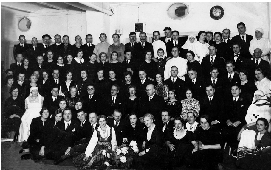
12. attēls. Visdrīzāk – AA darbinieku kopīgais foto. Iespējams, pārsvarā vidējais un jaunākais personāls, slimnīcas ierēdņi