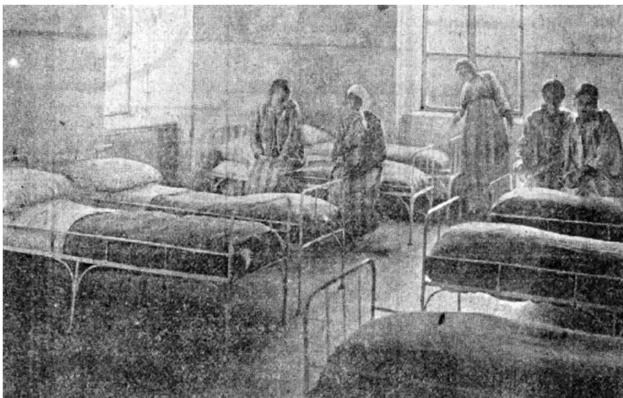
5. attēls. Sieviešu subakūta jeb “pusmierīgo” nodaļa, nepārtraukti uzraugāmo slimnieču palāta, visticamāk, “kalna mājā” [56]. Istabā redzamas tikai slimnieču gultiņas, nav pat aizkaru – drošības apsvērumu dēļ