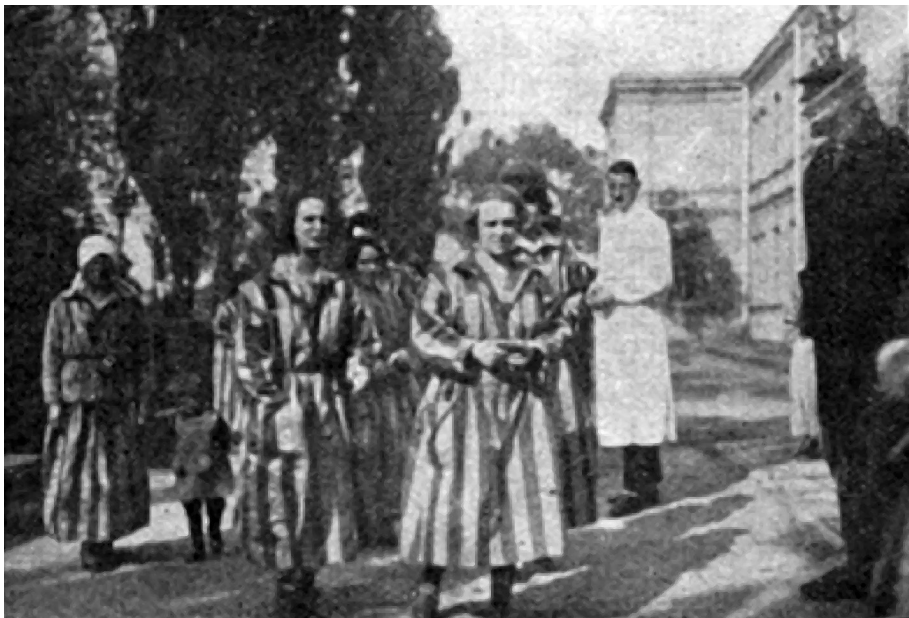
4. attēls. AA slimnieču grupa pastaigā slimnīcas teritorijā [47]. Fotografijas uzņemšanas vieta, iespējams, tā pati, kas 8. attēlā. Slimniecei pa kreisi pie rokas nāk meitenīte