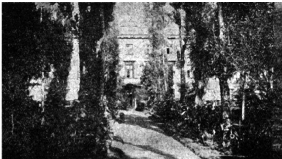
2. attēls. Slimnīcas dārzs. Iespējams, ceļa galā redzama kādreizējās “darba mājas” ēka, kur atradās arī AA administrācija [76]