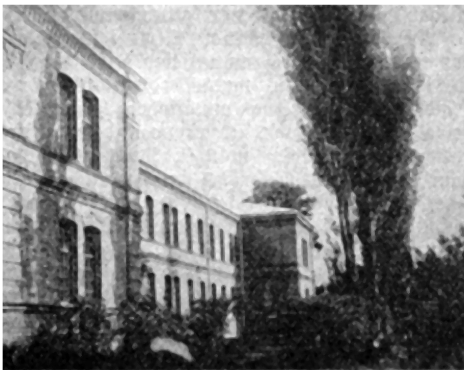
3. attēls. “Kalna māja” ar akūto un subakūto (“trakojošo un pusmierīgo”) vīriešu nodaļu, kur notika svinības un fotografēšanās [76]