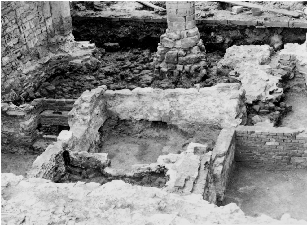
2. attēls. Kriptas Ikšķiles baznīcā. Pēc Graudonis, J. Ikšķiles pilsvietas un baznīcas 1968.–1974. gada arheoloģisko izrakumu pārskats, VIAA; 302.

kapu vietas – kriptas ( 3,2\text{--}3,4 \times 2,0\text{--}2,4\text{ m} ) 32 (2. attēls). Ēvalds Mugurēvičs pieņem, ka tieši šajās kriptās bija apglabāti pirmie bīskapi un divi nomocītie libieši. 33