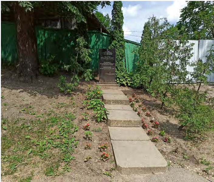
8.5. attēls. Piemineklis pie Leščinska dārza.

teiksim, kur šie uzvārdi parādās tajās grāmatās un rakstos, tad viņi visi tur ir. Būtu labs materiāls, kā to redzēt. Mēs ar jaunāko dēlu aizgājām, viņu interesē. Kaut vai to rakstu valodu, kuru daudzi nav redzējuši, tie burti, tās zīmes, tās zvaigznes, tas viss ir neparasts un interesants.” (T7)