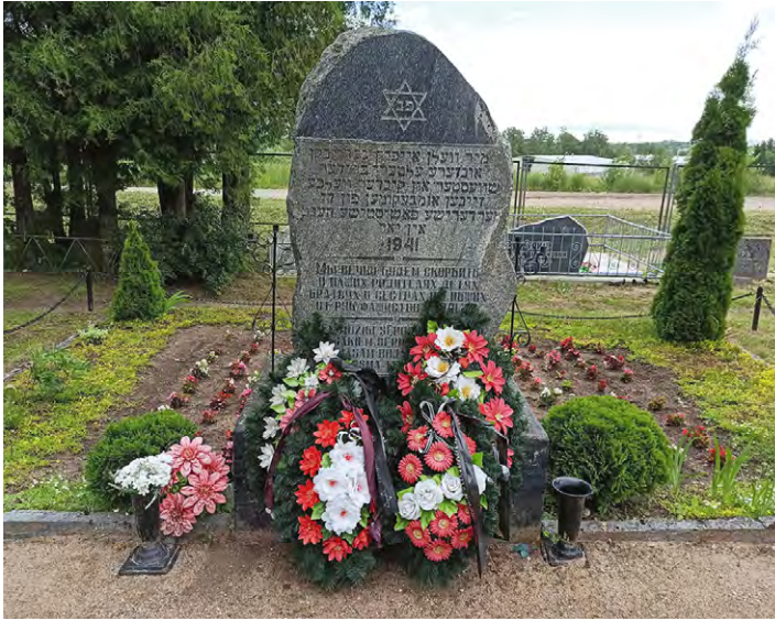
8.3. attēls. Holokausta piemineklis Rēzeknes ebreju kapsētā.

uzmanība informācijai avīzēs (T6). Izskanēja arī pieņēmums, ka tā meklējama interneta vidē, “jo tur visu var atrast” (T3). Vērigākie pilsētnieki atzīst, ka ne vienmēr pievērš uzmanību ziņām par holokausta pieminekļiem, tomēr līdz ar Rēzeknes Zaļās sinagogas atjaunošanu arī informācijas aprīte ir uzlabojusies: “Teiksim, tajos pēdējos ceļvežos es esmu ievērojusi, ka jau ir iekļauti” (T8). Intervētie atzīst, ka vēlētos uzzināt vairāk ne tikai par holokaustu, bet arī par ebreju vēsturi kopumā: “Jo man liekas, ka tie bija bagātākie Rēzeknes cilvēki, cilvēki, kuri lielā mērā uzbūvēja Rēzekni, nu ne tikai Rēzekni. Es domāju, ka tur ir daudz izcili prāti, kas šajos kapos apglabāti. Būtu svarīgi uzzināt gan par šiem cilvēkiem, gan par šīm kapu tradīcijām, kas latviešiem ir svarīga tēma.” (T7)