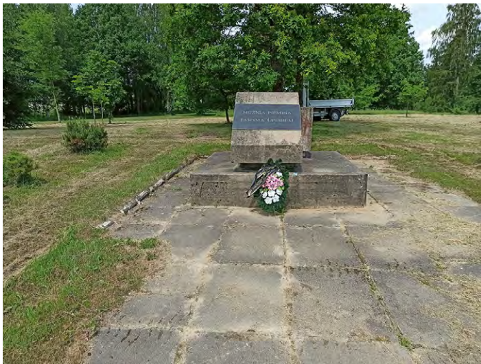
8.4. attēls. Holokausta piemineklis Vipingas mežā.