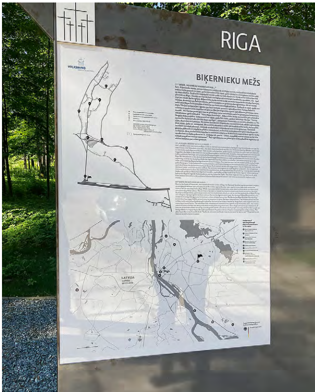
4.3. attēls. Ar Vācijas Federatīvās Republikas Ārlietu ministrijas finansiālo atbalstu uzstādītais informācijas panelis pie ieejas Biķernieku memoriālā 2022. gada jūnijā.