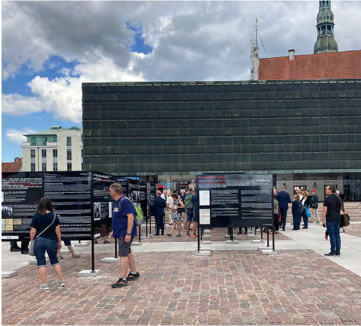
4.2. attēls. Austrijas un Vācijas vēstniecības Rīgā sadarbībā ar muzeju “Ebreji Latvijā” veidotās izstādes atklāšana 2022. gada 4. jūlijā Strēlnieku laukumā Rīgā.