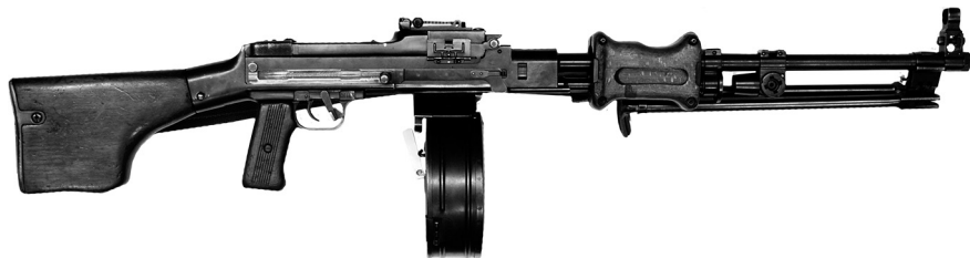
3. attēls. RPD ložmetējs. Avots: Latvijas Kara muzejs; krājuma Nr. LKM-6-35113/903-IE Figure 3. RPD machine gun. Source: Latvian War Museum; Item No: LKM-6-35113/903-IE