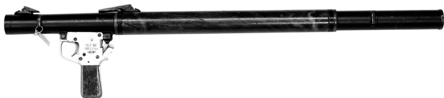
4. attēls. RPG–2 granātmetējs. Avots: Latvijas Kara muzejs; krājuma Nr. LKM-6-35128/918-IE Figure 4. RPG–2 grenade launcher. Source: Latvian War Museum, Item No.: LKM-6-35128/918-IE