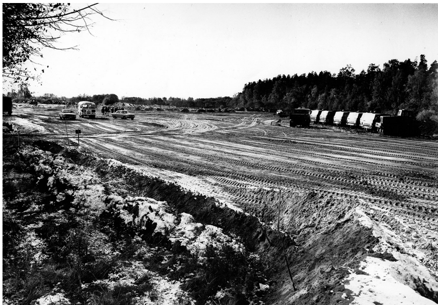
2. attēls. Robežkontroles punkta “Meitene” celtniecība. 1992. gada 13. oktobris.

Figure 2. Construction of the “Meitene” border inspection post. Photography by Valdis Alberts. 13 October 1992. Source: Latvian War Museum, Item No.: LKM 6-61731-2812-FT