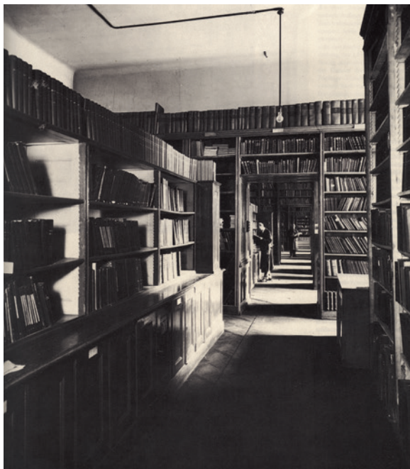
2 Vīnes Tehniskās universitātes bibliotēka 20. gs. sākumā