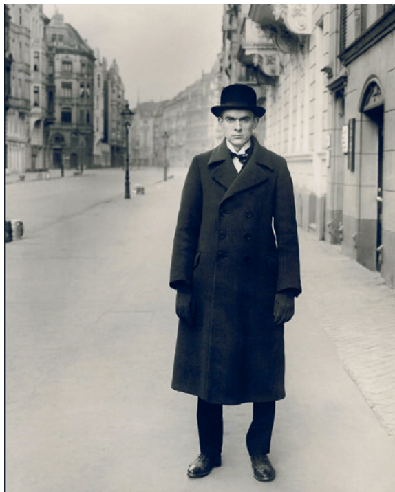
1 Roberts Mūzils ( Robert Musil , 1880–1942)