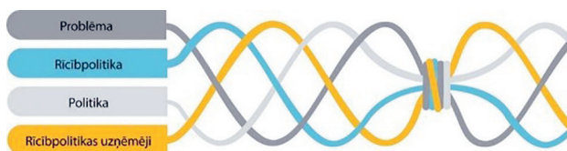
2. attēls. Daudzo strāvājumu sistēma un iespējas logs rīcībpolitikā [Kingdon 2014]