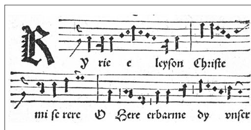
6. attēls. Kyrie no 1537. gada izdevuma

Pārskatu pār reformācijas gadsimta baznīcas mūziku Rīgā vēlos noslēgt ar ieskatu Paula Bucena ( Paulus Bucenus ) darbos. P. Bucens var tikt uzskatīts par pirmo profesionālo Rīgas un Vidzemes baznīcmūziķi un komponistu. Par viņa dzīvi pirms nokļūšanas Rīgā zināms maz. Par studijām Greifsvaldes Universitātē liecina 1568. gada ieraksts matrikulā, ka viņš imatrikulēts bez maksas. 10 P. Bucena komponētā Mateja pasija ( Passio Domini nostri Jesu Christi secundum Mattheum ) izdota Štetīnē (tag. Ščecina) 1578. gadā, kamēr pārējās vairāk nekā 150 kompozīcijas tapušas Rīgā, kur viņš strādāja par Doma baznīcmūziķi. Darbu skaits