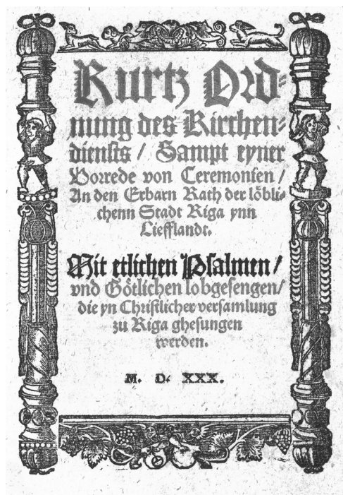
2. attēls. 1530. gada izdevuma titullapa.

Uppsala universitetsbibliotek (S-Uu) Obr. 49:42 1