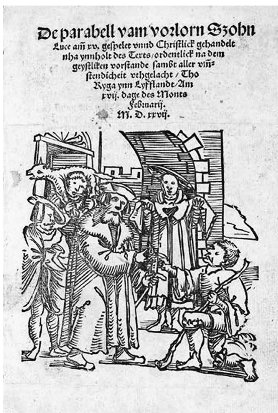
1. attēls. Līdzības par pazudušo dēlu titullapa. Hercoga Augusta bibliotēka, Wolfenbüttel, LO:7812